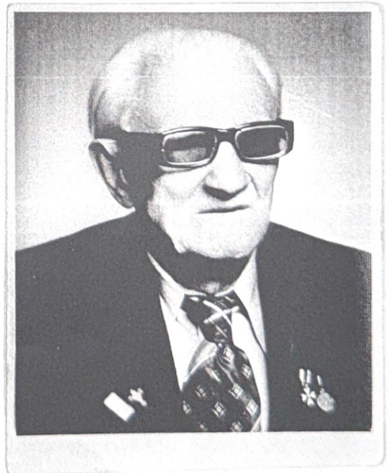
Mój ojciec w wieku 90-ciu lat